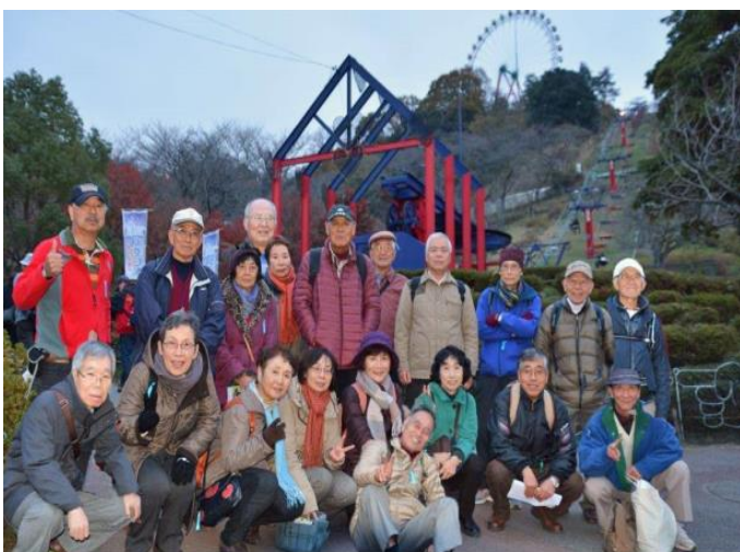
27.12.2 相模湖方面バス旅行