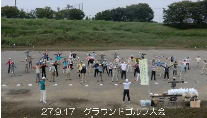
27.9.17 グラウンドゴルフ大会