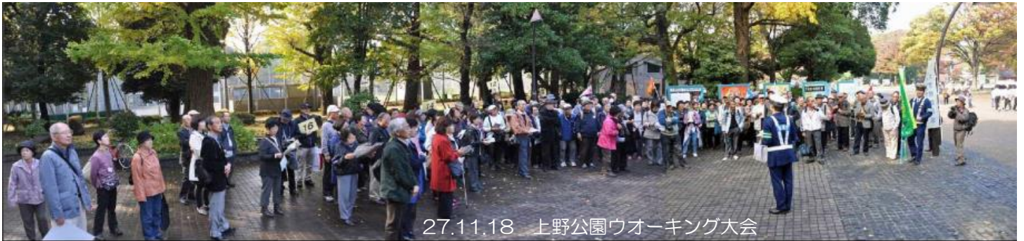
27.11.18 上野公園ウォーキング大会