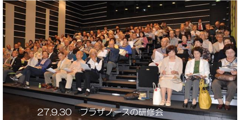
27.9.30 プラザノースの研修会