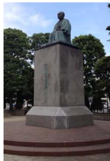
深谷駅北口の渋沢栄一の銅像