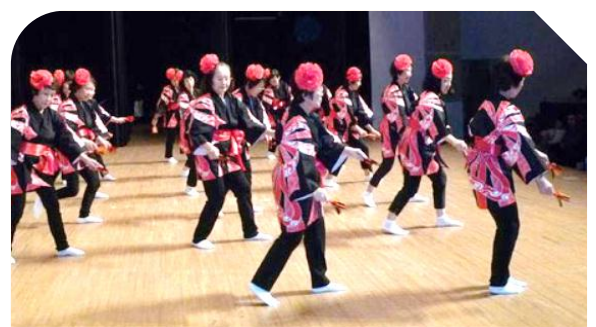
ヨサコイレディースとその仲間たち