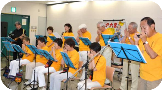
ハーモニカ演奏（ブルースハーブ ハーモニカクラブ）