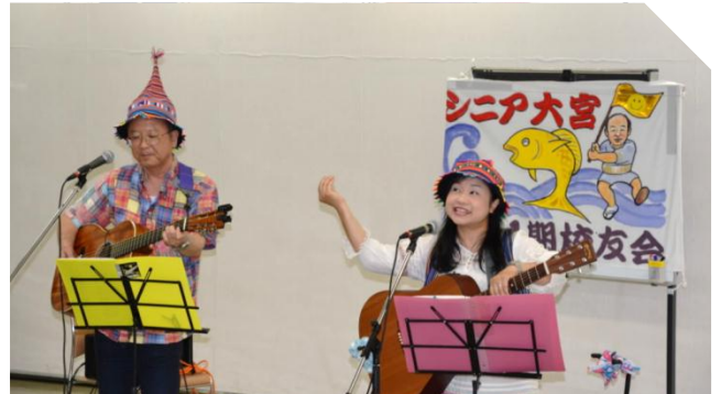
フォークソングライブ（フォークユニット福神漬）