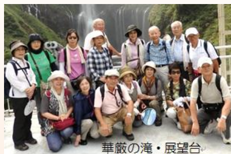
華嚴の滝・展望台