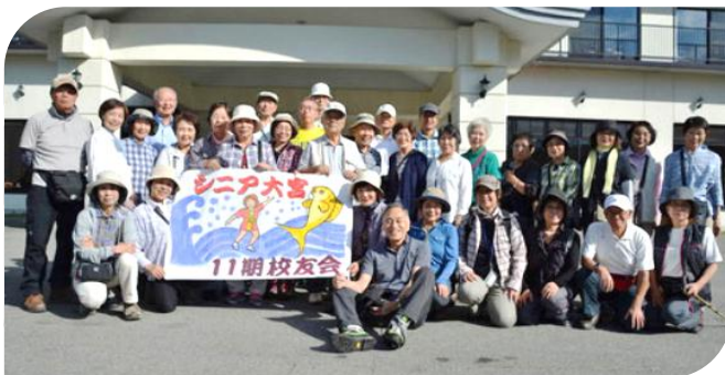
参加者全員で記念撮影