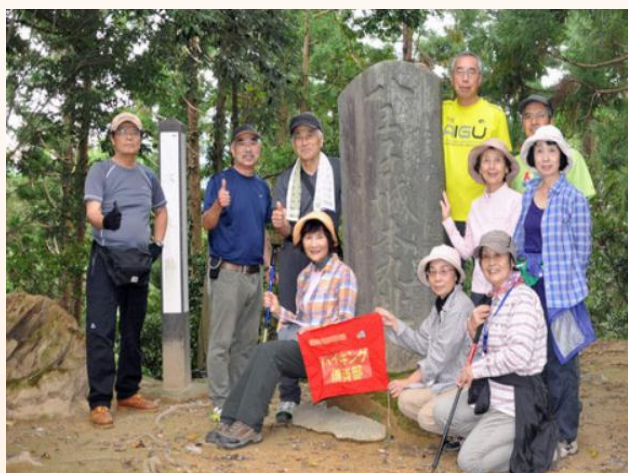
28.10.19 八王子城本丸跡にて

12月7日：小川・四津山神社、12月19日：高尾山（山頂でダイヤモンド富士を見る）