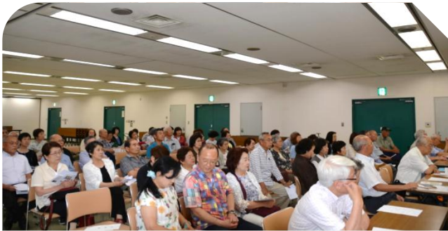
演奏を熱心に聞き入る皆さん