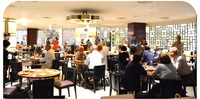
放課後クラブ（中華料理と飲茶の食べ放題バイキング）