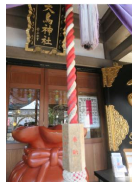
大鳥神社の巾着形賽銭箱