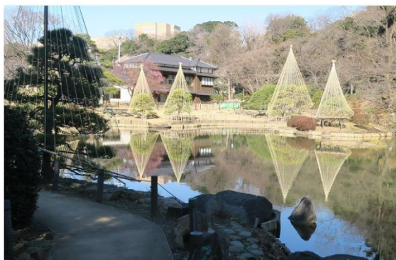
細川家別邸・池泉式庭園の大池に写る松の雪吊り

肝心の七福神は都電鬼子母神前駅周辺を中心に弦巻通り、南池袋通り商店街の左右に有った。町起こして『雑司ヶ谷七福神の会』を結成し2011年にスタートしてまだ数年しか経っていない。そのせいか布袋尊(中野ビル)福祿寿(仙行寺)はビルの中だった。吉兆天(清土鬼子母神)から福祿寿まで7つの寺社を回った。途中「雑司ヶ谷案内所」に寄り枯ススキ「みみずく」の作り物を拝見した。一番小さい物でも1,000円の値が付いていた。恵比寿神(大鳥神社)の賽銭箱は大きな巾着形。大黒天(鬼子母神堂)境内には樹齢600年余、樹高30m、幹回り8mの巨木銀杏が鎮座していた。弁財天(観静院)は石仏で「一心合掌 功德無量」水掛弁天とあり、かけられた水が光っていた。今日は東洋と西洋の寺社を巡り『七福神巡り』が八つのパワースポット巡りとなった。御利益と健康を全身いっぱいにもらった一日となった。