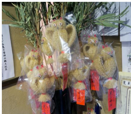
雑司ヶ谷 枯ススキ「みみずく」